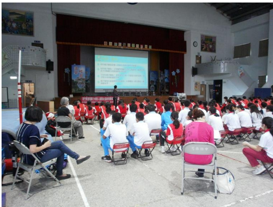
110/11/03(三)芎林國中場次照片 2-2