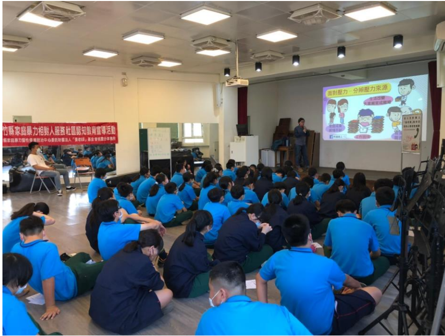
110/4/21(三)北埔國中社區宣導活動照片 1-2