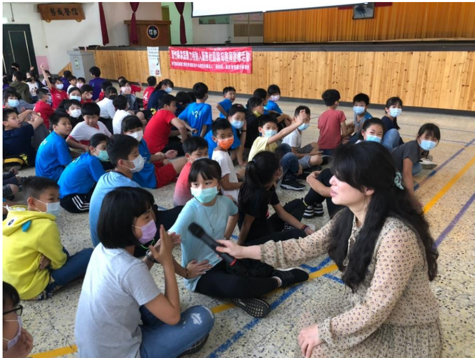
110/4/13(二)信勢國小社區宣導活動照片 1-1