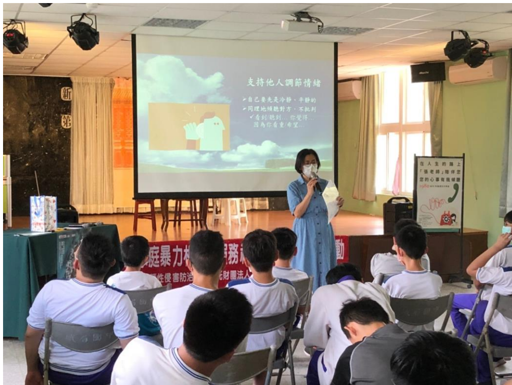
110/5/11(二)峨眉國中社區宣導活動照片 1-1