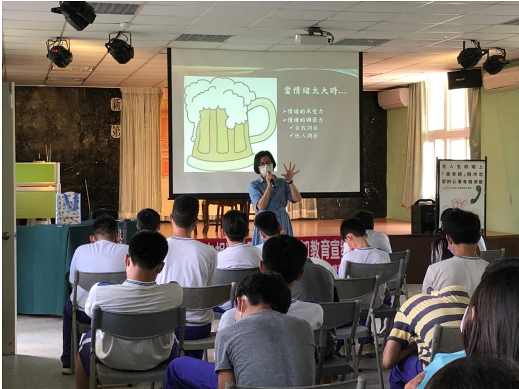
110/5/11(二)峨眉國中社區宣導活動照片 1-2