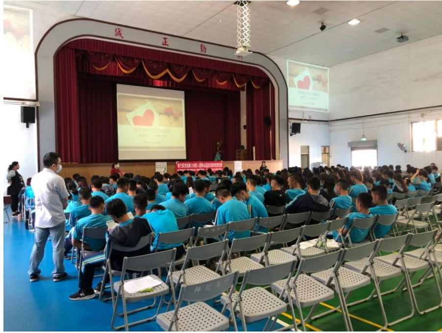
110/4/22(四)仰德高中社區宣導活動照片 1-2