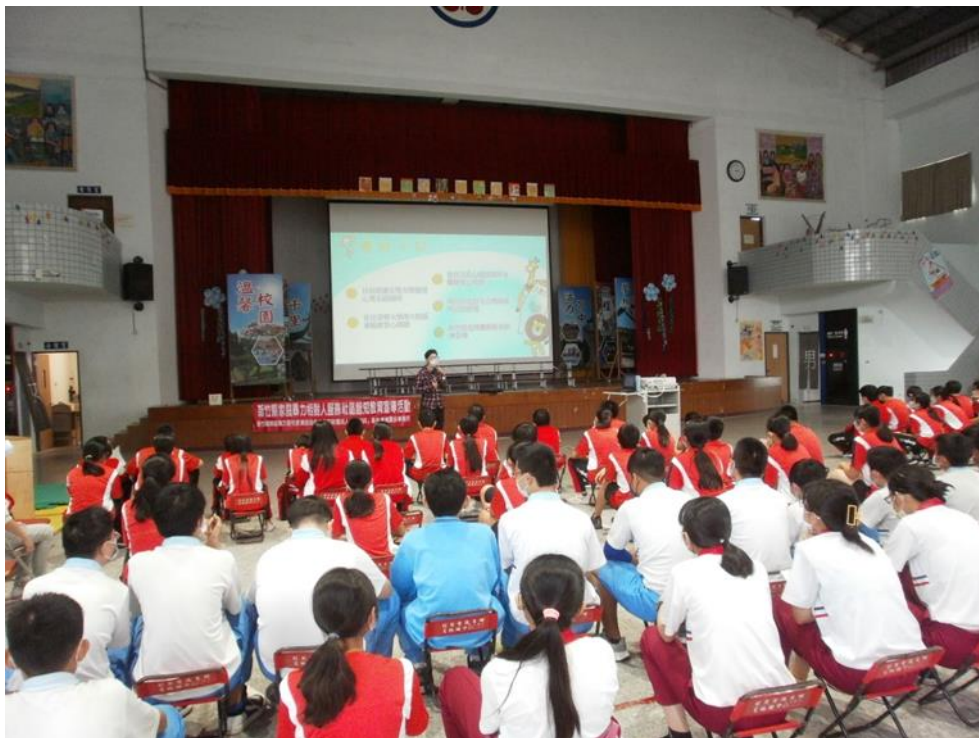
110/11/03(三)芎林國中場次照片 2-1