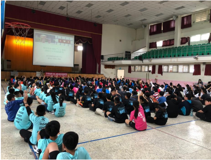
110/4/13(二)信勢國小社區宣導活動照片 1-2