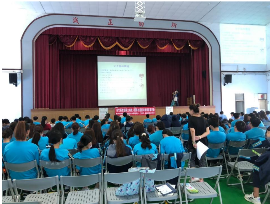
110/4/22(四)仰德高中社區宣導活動照片 1-1