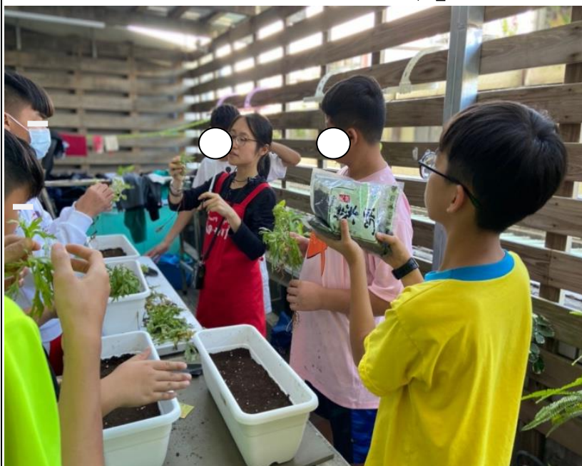
110 年永安綠色隧道騎車踏浪玩沙趣